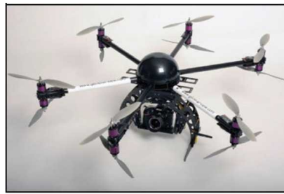
Вертолетного типа (многомоторные)